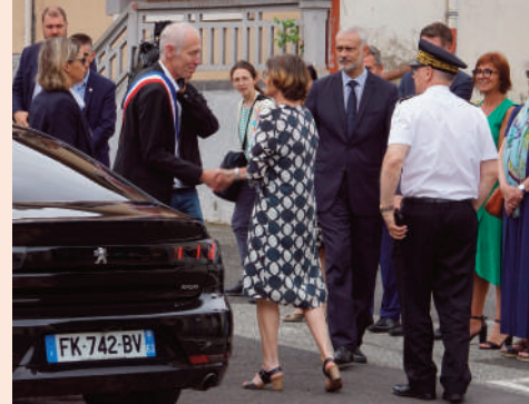
L'arrivée de Madame La Ministre Agnès Firmin-Le Bodo

Madame la ministre a été reçue et a parlé de Pontgibaud sur les 3 grands médias «La Montagne, France Bleu Pays d'Auvergne, FR 3 Puy de Dôme Auvergne-Rhône-Alpes».