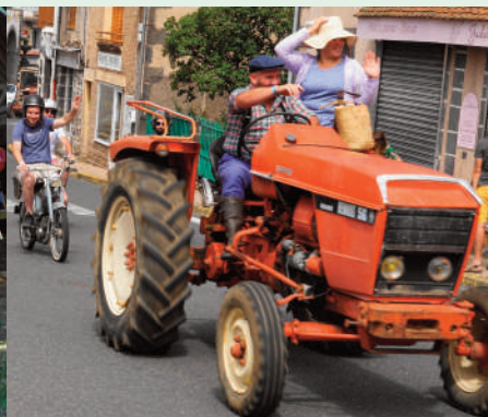
Tracteurs, mobs et vieilles bagnoles !