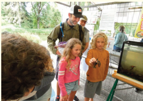
La pêche aux écrevisses

... ou comment joindre l'utile à l'agréable. L'objectif est l'élimination de trop nombreuses écrevisses nuisibles invasives «Signal» ou de Californie. Après la mise en conformité avec la réglementation, le prêt du matériel et une rapide formation, les néophytes de la pêche à la balance, ont pu s'initier à la capture des prédateurs.