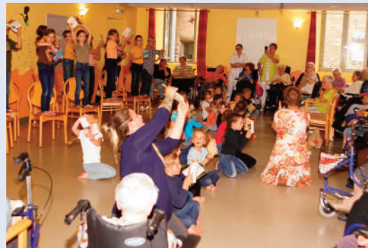
Spectacle de danse avec Gibal'Danse