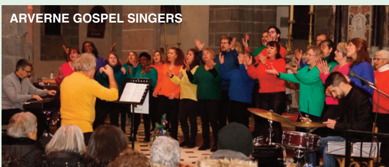
ARVERNE GOSPEL SINGERS

Malgré les frimas de décembre en rejoignant le public créant une chaleureuse ambiance les choristes de la formation Clermontoise, ont réussi le tour de force de faire chanter les spectateurs avant de satisfaire aux nombreux rappels.