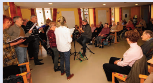
Concert avec les Voies Lactées