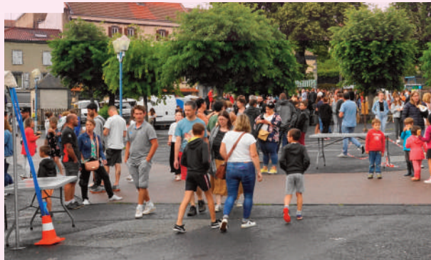
Reprise de l'effervescence après la pluie