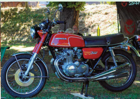
Suffisamment rare et belle pour attirer l'attention