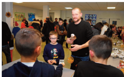
Marché de Noël à l'école

Très attendu avec la complicité des enseignants et des agents municipaux, après le menu de fin d'année, avec les friandises, le marché de Noël et ses fructueux échanges de guirlandes, boules et autres étoiles confectionnées par les élèves, le Père Noël est arrivé avec dans sa hotte un livre pour chacun.