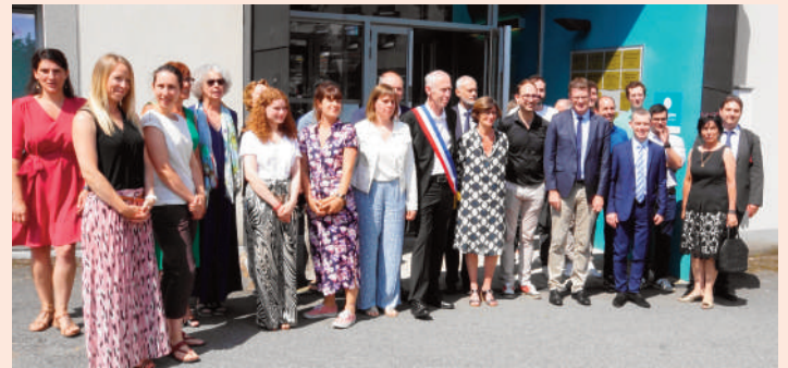
26 juin 2023 - Visite de Madame la Ministre Agnès Firmin-Le Bodo