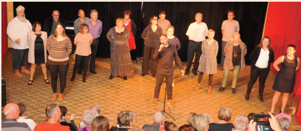
Tous en scène pour le finale

L'atelier Gibaldipontin a proposé un spectacle de qualité, interprétant un répertoire habilement varié mêlant humour, (Fleurs de province, Le rire du sergent), bonne variété (Nathalie, Désormais, Pour un flirt, Mon mec à moi) et des standards internationaux (New-York New-York, Hijo de la luna), toujours interprétés avec justesse, alternant avec des «brèves de comptoir ou «dernières nouvelles» sentant le vécu, sans oublier une «Leçon de jardinage» à deux niveaux de lecture, qui sans jamais tomber dans le vulgaire a provoqué l'hilarité générale. Trois heures d'un divertissement familial offert en entrée libre, suivi d'un Karaoke où les plus téméraires ont pu se faire plaisir et devenir les vedettes d'un moment.